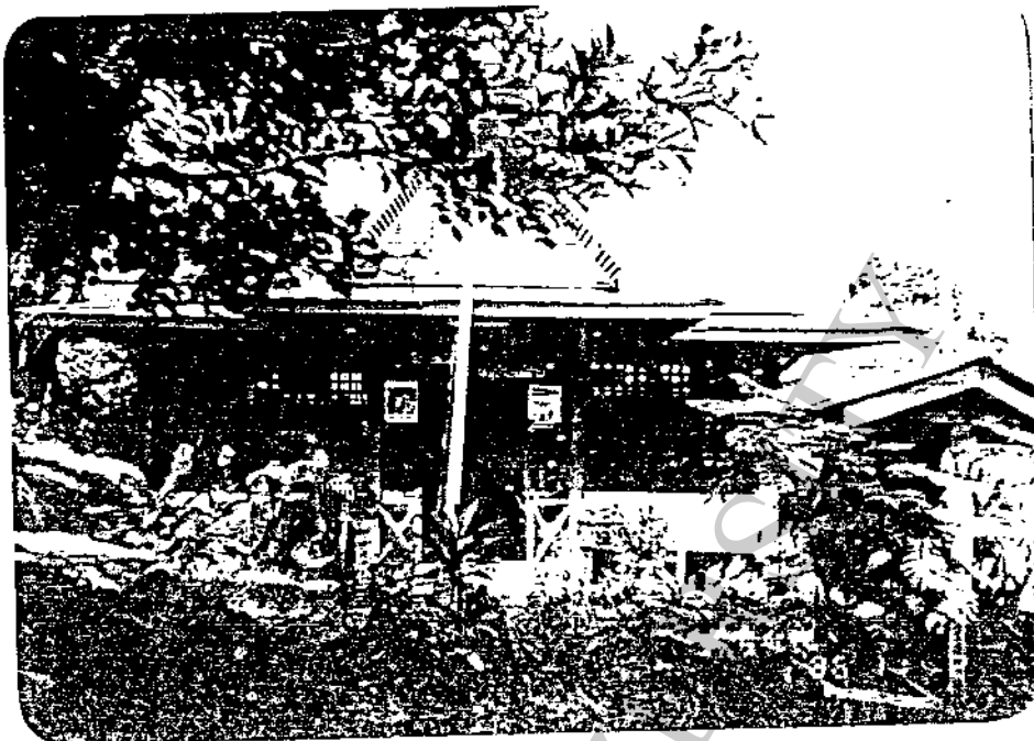
บ้านไม้ซึ่งประจักษ์มานาน