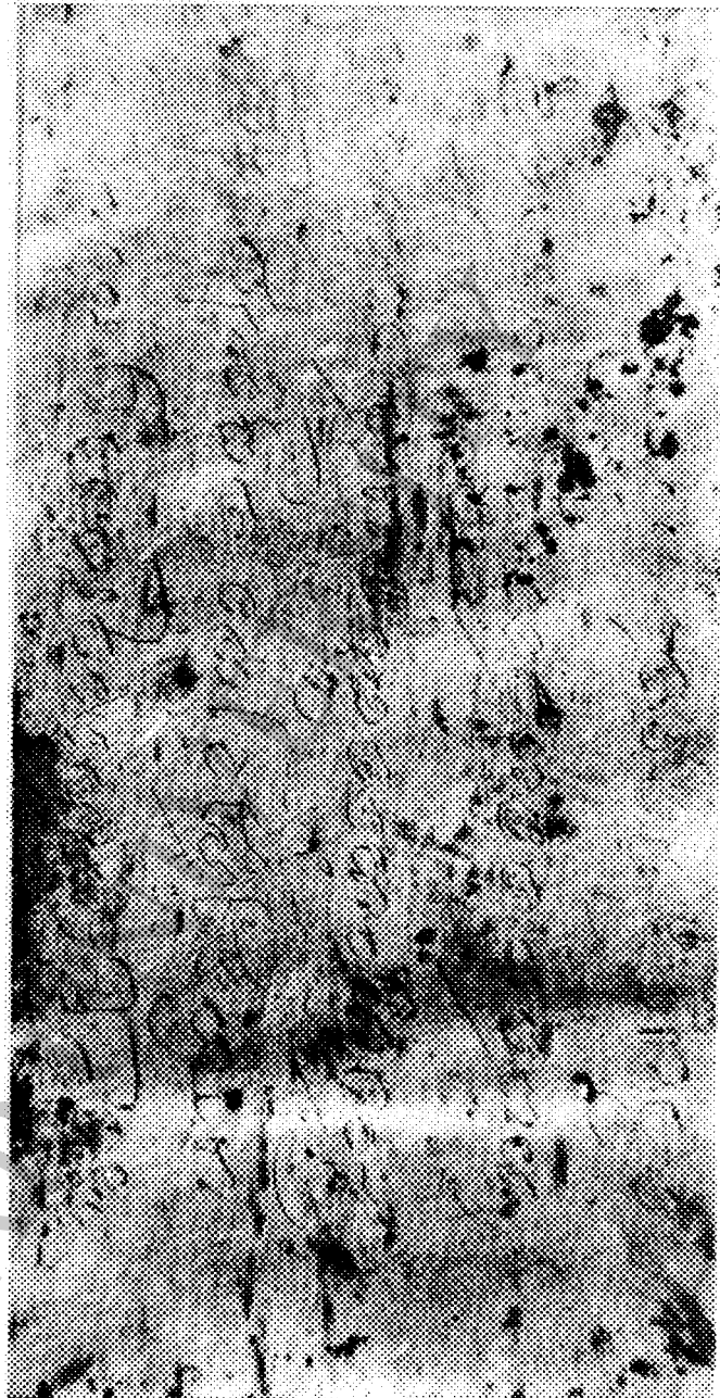
ตัวอย่าง อักษรบางส่วนที่จารึกไว้บนหลายเงิน