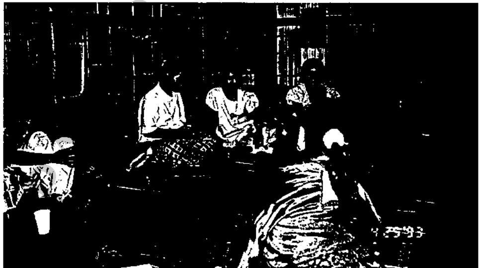
สนทนากับตัวแทนกลุ่มสตรีบ้านคอคตยาว