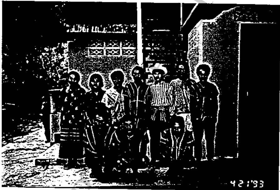
ตัวแทนคณะกรรมการหมู่บ้านแคววัวคำ

หัตถกรรมควรตั้งสหกรณ์หัตถกรรม เพื่อหารายได้จุนเจือครอบครัว ส่วนเจ้าหน้าที่ สนามนั้นในอนาคตจะเป็นชายหรือหญิงก็ได้ แต่ควรเป็นเผ่าอาข่า ถ้าเป็นเผ่าอื่น ๆ ควรจะเป็นผู้หญิง อายุก็ไม่ควรต่ำกว่า 20 ปี เผ่าเดียวกันนั้น การสื่อสารไม่มีปัญหา เข้าใจวัฒนธรรม ปรับตัวได้ ง่าย ภูมิสำเนานั้นควรมาจากที่อื่น ๆ เพราะในหมู่บ้านข้างชอนยัง ไม่มีใครเหมาะสม