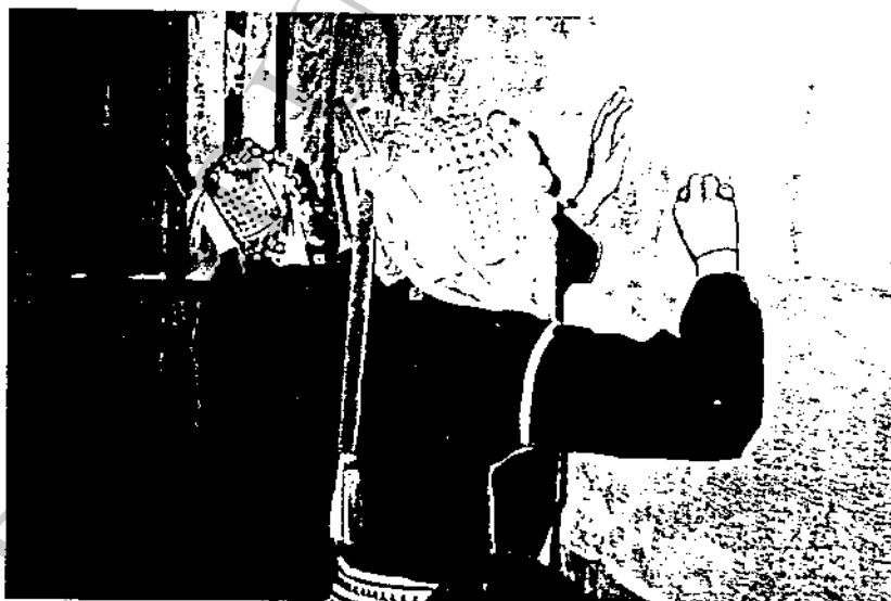
ทดสอบการเขียนชื่อ นามสกุล ของกลุ่มสตรีบ้านห้วยสาตุ

ในภาพรวมของกิจกรรมทั้ง 4 กิจกรรมนั้น กลุ่มสตรียังมีโอกาสไปทัศนศึกษา ดูงาน ด้วยการสนับสนุนจากโครงการฯ อาทิ ที่ตอแยแม่สลอง อำเภอแม่จัน จังหวัดเชียงราย จังหวัดน่าน จังหวัดลำพูน และจังหวัดเชียงใหม่ เป็นต้น ในการปรับปรุงกิจกรรมนั้น เนื่องจากที่ผ่านมากลุ่มสตรีต้องอาศัยโครงการฯ มาตลอด ทุกกิจกรรมมีประโยชน์ กลุ่มพร้อมจะเข้าร่วมทุกกิจกรรม ถ้าโครงการฯ ช่วยเหลือ สำหรับปัญหาภายในกลุ่มสตรีนั้นพบว่า ไม่มีปัญหา แต่ก่อนเริ่มจัดตั้งกลุ่มเกิดปัญหาเรื่องการยอมรับของผู้ชาย (สามี) ที่ว่าทำไมโครงการฯ ถึงส่งเสริมเฉพาะกลุ่มผู้หญิงเท่านั้น ทำให้ผู้ชายไม่สามารถเข้าร่วมประชุมได้ ถูกผู้ชายกลั่นแกล้งปิดประตูบ้านบ้าง ไม่ยอมดูแลเลี้ยงลูกแทนภรรยา ที่จะต้องไปประชุมตอนกลางคืนบ้าง ต่อมาโครงการฯ จึงเข้าไปชี้แจงเหตุผลต่าง ๆ ที่ต้องการให้กลุ่มสตรีมีบทบาทบ้าง ระยะต่อมาถึงปัจจุบันนี้ปัญหาการยอมรับของผู้ชายนั้น ไม่มีแล้ว ประเด็นที่กลุ่มสตรีได้ฝากถามโครงการฯ คือ กิจกรรมด้านการศึกษา เนื่องจากกลุ่มสตรีที่มีลูกหลานอยู่ในวัยเรียนเป็นจำนวนมาก ต้องการให้โครงการฯ ติดต่อบริษัทงานให้ตั้งโรงเรียนภายในหมู่บ้าน และให้มีครูสอนประจำ ที่ผ่านมามีเด็กต้องเดินไปโรงเรียนบ้านห้วยไคร้ ระยะทาง 4 กิโลเมตร วันไหนฝนตกเด็กไม่สามารถไปโรงเรียนได้