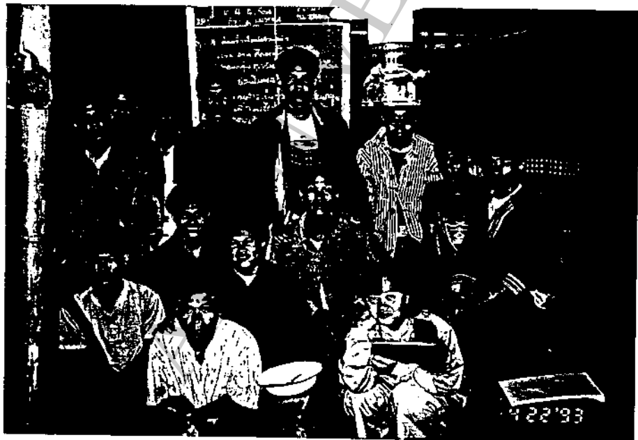
สนทนากับตัวแทนคณะกรรมการหมู่บ้านลิโซ่