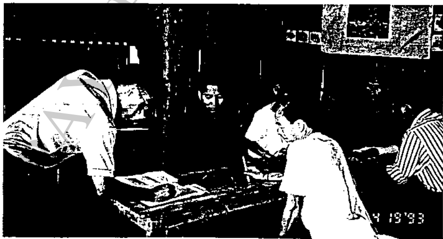
๒๖ สนทนากับตัวแทนคณะกรรมการหมู่บ้านปางขอน

ในภาพรวมของทุกกิจกรรมที่ให้การส่งเสริมพัฒนาหมู่บ้านปางขอนนั้น ในระยะเริ่ม แรกประสบปัญหาหนักทั้งจากการยอมรับของผู้ชาย และผู้นำหมู่บ้าน จึงเกิดความท้อแท้มาก กลุ่ม ไปขอความร่วมมือก็ไม่ได้รับการสนับสนุน บางครั้งถูกต่อว่า ปัจจุบันก็ยัง ไม่มีการยอมรับจากกลุ่มผู้ ชายอย่างแท้จริง และยังไม่ร่วมมือทางด้านกิจกรรม เช่น การสร้างรั้วที่สำนักงานไม่มาช่วยเลย จนเกิดการทะเลาะกัน ช่วงหนึ่งปรากฏว่ามีเจ้าหน้าที่สนามลาออก ไม่มีเจ้าหน้าที่ประจำอยู่ แต่ อย่างไรก็ตามได้รับการแก้ไขและให้กำลังใจจากโครงการฯ และกลุ่มสมาชิกอย่างต่อเนื่อง จน สามารถดำเนินงานต่อในหมู่บ้านได้ กลุ่มสตรียังเสริมอีกว่ายัง ได้มีโอกาสไปทัศนศึกษาดูงาน การ ฝึกอบรมทำให้มีโอกาสพบเห็นสังคมภายนอกได้ ผู้หญิงมีบทบาทมากขึ้น มีความกล้า รู้จักพึ่งตนเอง ครอบครัวมีรายได้เสริม บางคนสามารถพูดภาษาไทยได้มากกว่าในอดีต แต่สิ่งที่กลุ่มสตรีได้ฝากให้ โครงการฯ ทราบคือ พวกเขาจะดำเนินกิจกรรมที่เคยได้รับการสนับสนุนอีกต่อไป และต้องการให้ มีเจ้าหน้าที่สนามประจำอยู่ หมู่บ้าน 1 คน พร้อมทั้งการเพิ่มการดูงานนอกสถานที่ ตลอดจนการส่ง ข่าวสารให้ชาวบ้านได้รับทราบด้วย