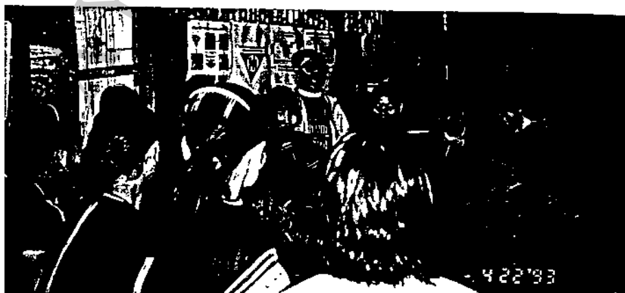
สนทนากับตัวแทนกลุ่มสตรีบ้านลิไซ