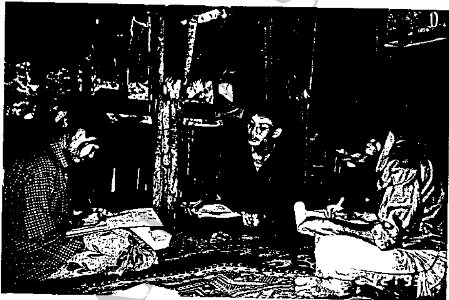
สนทนากับคุณสมเเกตุ ชูระวร เจ้าหน้าที่สนาหมู่บ้านแคววักคำ

ถือมีมากด้วย ภูมิลำเนาต้องการคนต่างถิ่น ข้อเสนอแนะต่อโครงการฯ คณะกรรมการต้องการให้โครงการฯ ดำเนินการในหมู่บ้านต่อไปอีก เน้นด้านหัตถกรรมให้มาก ให้สมาชิกทุกคนได้ร่วมกันทำกิจกรรม เสริมการใช้สัจจาทวัตรธรรมชาติ ติดต่อกาตลาดด้วย สุดท้ายถึงแม้ว่าโครงการฯ จะเป็นการช่วยเหลือกลุ่มสตรีก็ตาม คณะกรรมการไม่รู้สักอย่างใด กลับตีใจที่สตรีมีงานทำ มีโอกาสได้สัมผัสสังคมภายนอกมากขึ้น ผู้ชายในหมู่บ้านจะให้กำลังใจอย่างเต็มที่ในทุกกิจกรรม ประโยชน์ที่ได้รับใช้ว่าจะอยู่กับกลุ่มสตรีฝ่ายเดียว แต่ตกอยู่กับชาวบ้านแคววักคำทั้งหมด หมู่บ้านมีความเจริญขึ้นมีความสะอาด มีความเป็นระเบียบด้วย