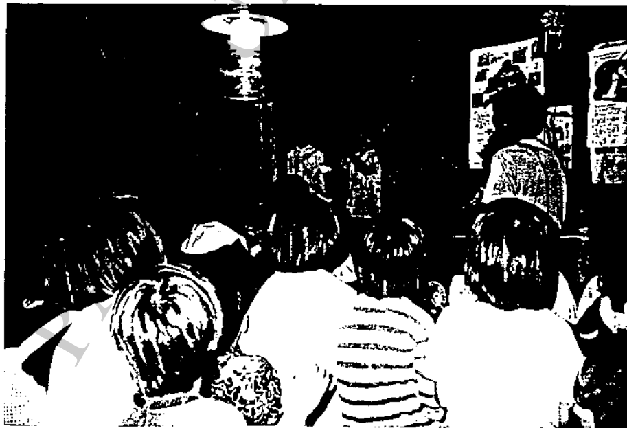
เด็กหมู่บ้านห้วยธาทุกกำลังร้องเพลงขณะที่แม่กำลังมีการประชุม