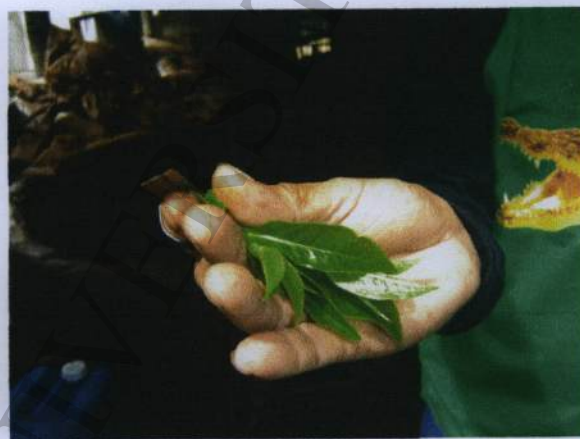
ยอดชาอัสสัม