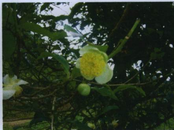
ดอกชาอัสสัม