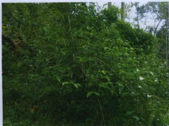
ต้นและใบชาอัสสัม