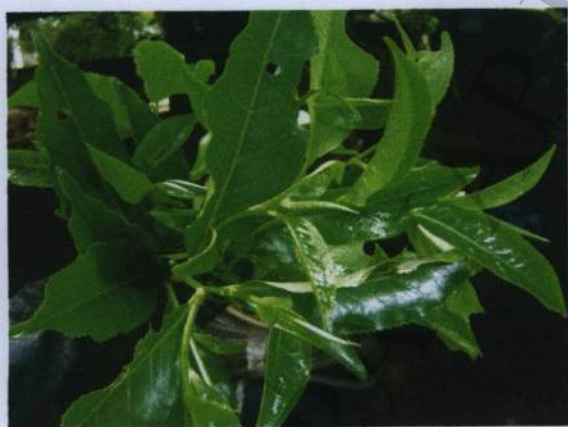
ยอดชาอัสสัม