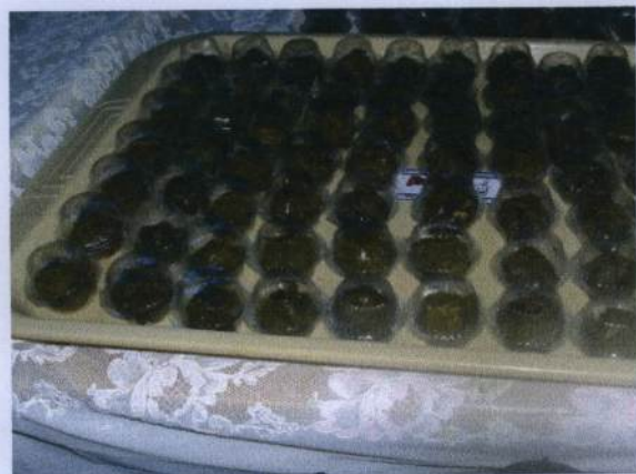
เมี่ยงทรงเครื่องบรรจุในกล่องพลาสติก