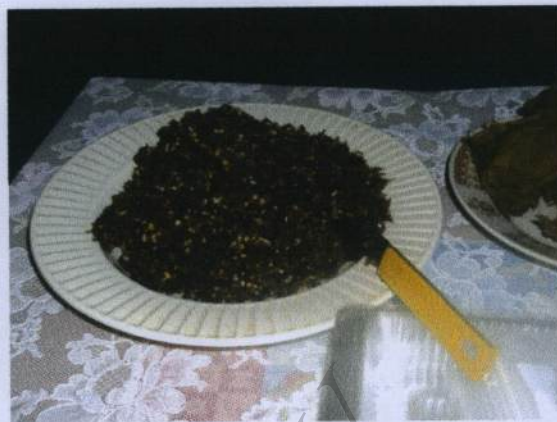
ไสเมี่ยงทรงเครื่อง