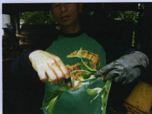
การตัดยอดชาอัสสัม