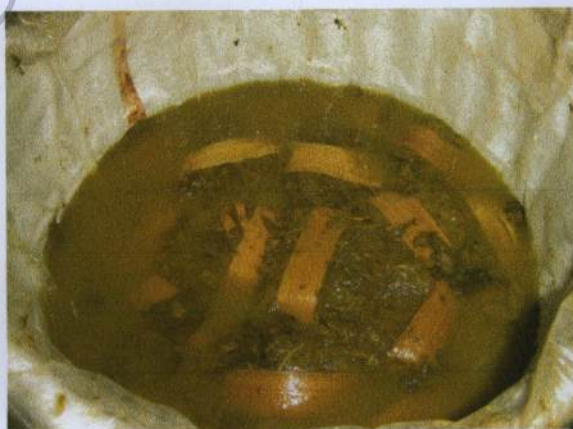
เมี่ยงในถังหมัก