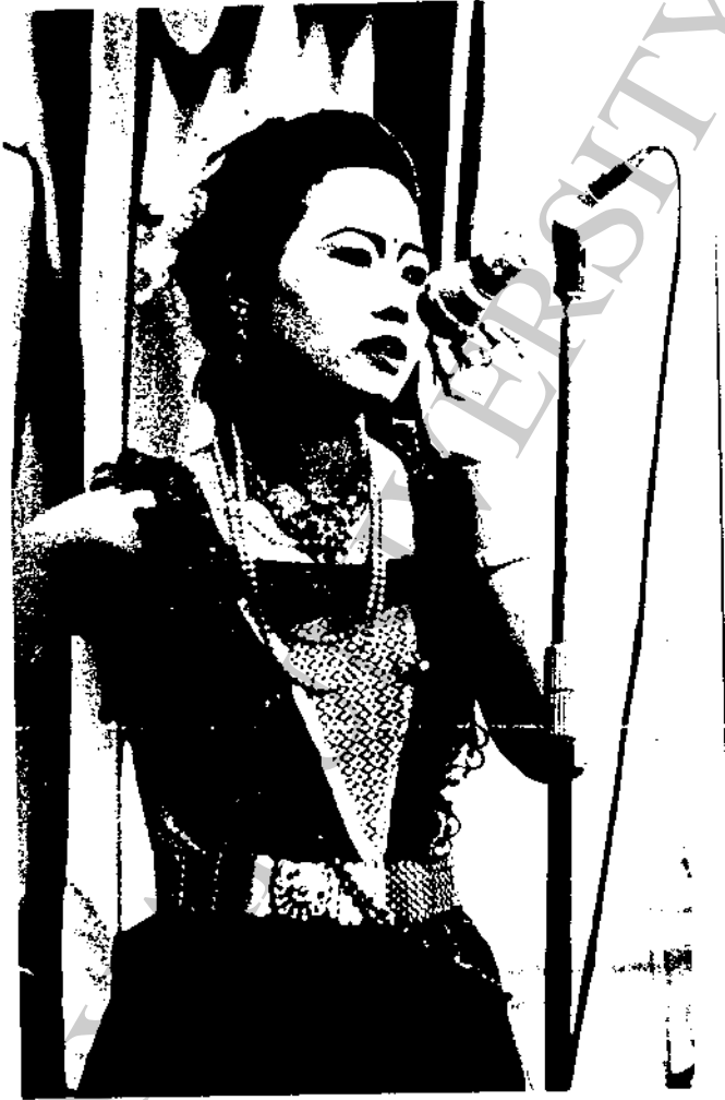
ภาพที่ 22 ลิเกคณะสมานนาฏศิลป์แสดงที่วัดคาน้ำทิพย์ อำเภอเมือง เชียงใหม่ แสดงวันที่ 7 เมษายน 2529 เรื่อง "บ๊าระวงศ์หงษ์อำมาตย์"