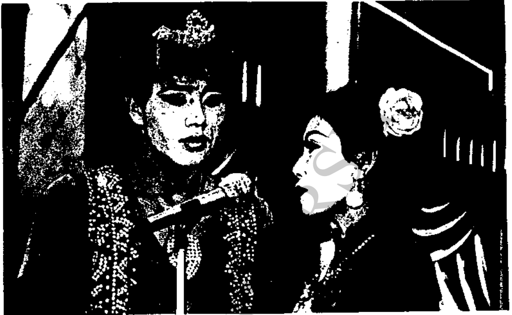
ภาพที่ 24 ลิเกคณะแก้วเสียงทอง แสดงที่วัดมหาวัน อําเภอเมือง จังหวัดลาหูนเมื่อวันที่ 6 เมษายน 2529 แสดงเรื่อง "รัตนามหาเทวี"

1.12 ในการแสดงลิเกแต่ละครั้งมีวิธีที่จะเลือกเรื่องแสดงหรือไม่ ในการแสดงลิเกแต่ละครั้งของคณะลิเก จะมีวิธีเลือก เรื่องที่จะแสดงด้วยเหตุผลที่ต้องเลือกนั้น เพราะต้องการเอาใจคนดู หรือ ชาวบ้าน ถ้าชาวบ้านชอบเรื่องในแนวใดก็จะจัดเรื่องให้ถูกใจ นอกจากจะ เอาใจคนดูแล้ว การเลือกเนื้อเรื่องต้องอาศัยสถานการณ์ ในหมู่บ้านนั้นด้วย อย่างเช่น สถานการณ์ในหมู่บ้านนั้น มีการหลอกลวงหญิงสาวไปขาย หรือ เกี่ยวกับปัญหาทางครอบครัว เหตุการณ์ที่เกิดขึ้นจริงในสังคม เช่น ฆาตกรรมที่ จังหวัดลาหูน มีลิเกแสดงออกชื่อจริงด้วย นอกจากนั้นก็ยังมีเรื่อง วังบัวบาน ทางคณะลิเกก็จะจัดเรื่องที่มีเนื้อหาที่สอดคล้องกับสถานการณ์นั้นด้วย