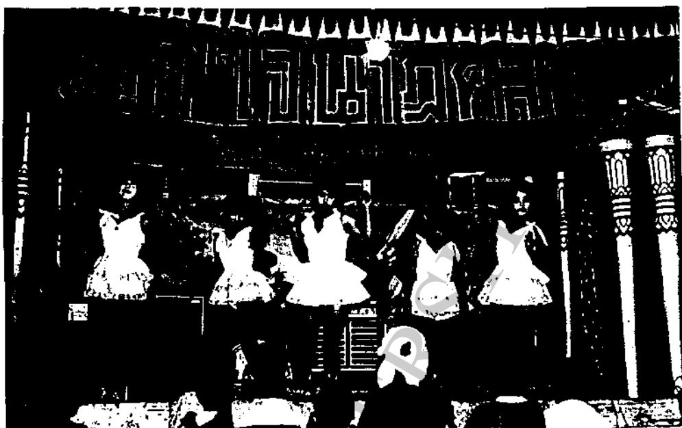
ภาพที่ 20 ลิเกคณะสุคติใจนาฏศิลป์แสดงที่วัดประตูป่า ตำบลประตูป่า อำเภอเมือง จังหวัดลาหูน ซึ่งก่อนจะมีการแสดงลิเก ก็จะมีการเต้นโชว์ ซึ่งเราเรียกว่าหางเครื่อง เต้นโชว์ก่อนแสดงเมื่อวันที่ 5 เมษายน 2529 (แสดงกลางคืน)