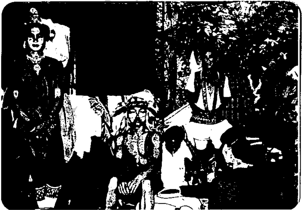
ภาพที่ 29 ความซุกมุ่นวันวายหลังโรงคณะสมชายนาฏศิลป์แสดงที่ วัดศรีโสภา อาเภอเมือง เชียงใหม่ เมื่อวันที่ 12 มิถุนายน 2529