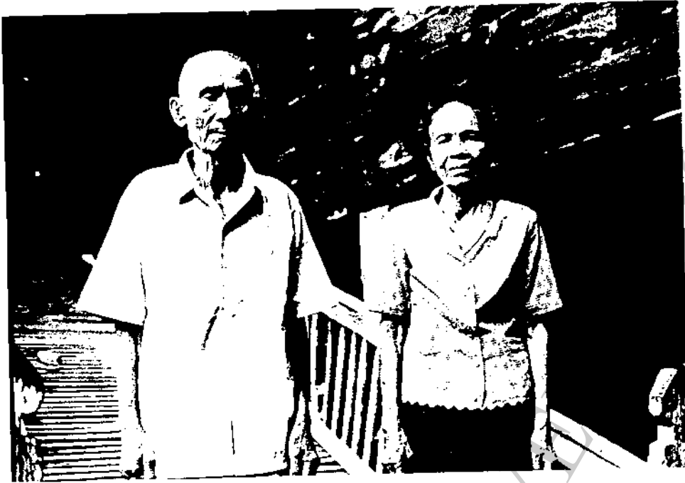
ภาพที่ 15 น้องภรรยา (นางพุด) ของครูสะอั้ง