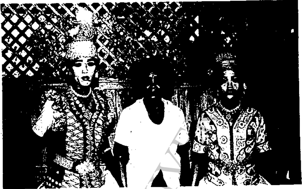
ภาพที่ 30 นักแสดงชายหญิง ของคณะสุคติใจนาฏศิลป์ ในภาพนี้จะเห็นว่า คนกลางนั้นเป็นแม่ของนางเอกที่ขึ้น ซ้ายมือ