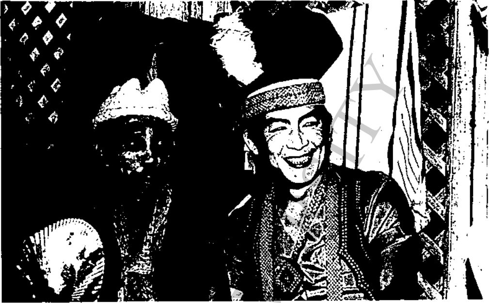
ภาพที่ 28 นักแสดงสุจริตใจนาฏศิลป์ แสดงกลางวันที่วัดพระคูบัว อาเภอเมือง ลพบุรี แสดงเรื่อง "บัวชายบึง" เมื่อวันที่ 5 เมษายน 2529