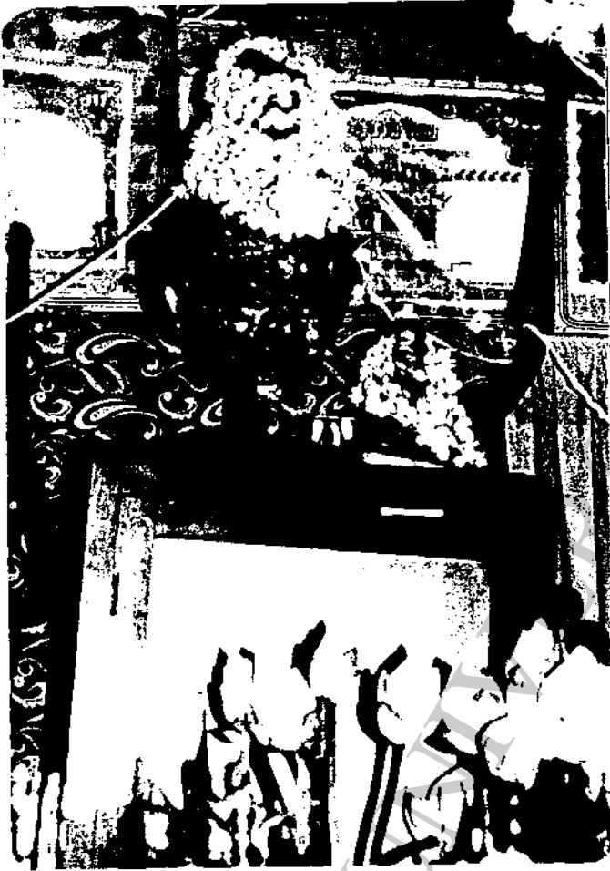
ภาพที่ 26 "ถาผี" หัวถาผีที่ลิเกทุกคน จะต้องยกย่องนับถือ และลิเกทุกคนจะ เรียกว่า "พ่อแก่"