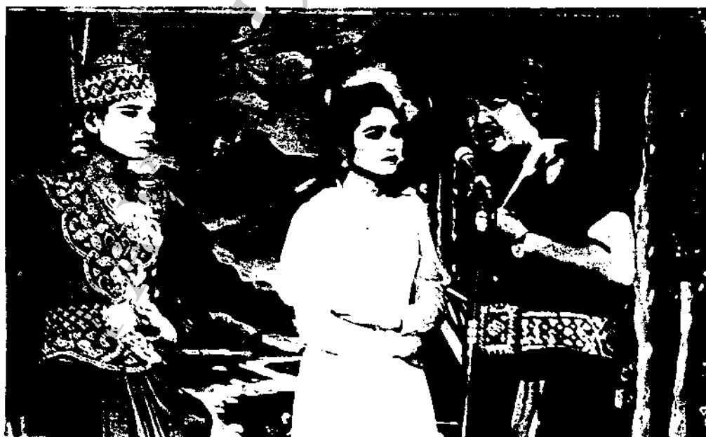
ภาพที่ 21 ลิเกคณะมีชัยนาฏศิลป์แสดงที่วัดท่าคันโจว อำเภอป่าซาง จังหวัดลาหูน วันที่ 6 เมษายน 2529