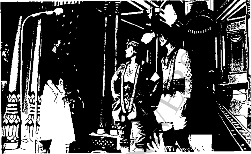
ภาพที่ 25 ลิเกคณะ ส.สันตะยอม 2 แสดงที่วัดแม่สารบ้านตอง อำเภอเมือง จังหวัดลพบุรี เมื่อวันที่ 4 เมษายน 2529 แสดงเรื่อง "ปลาตะเพียนทอง"

1.13 ทางคณะลิเก ได้ทุนมาจากไหน ที่จะจ่ายแก่ลูกน้อง ในค้ำบนทุนนั้น จากการสัมภาษณ์คณะลิเก ทำให้ทราบว่า ทางคณะลิเก ได้ทุนจาก เจ้าภาพที่เขาหาลิเกมาเล่น แล้วก็เอามาจ่ายเป็นค่าตัว ของนักแสดงส่วนเครื่องแต่งตัวนั้น ส่วนใหญ่นักแสดงจะต้องซื้อเอง