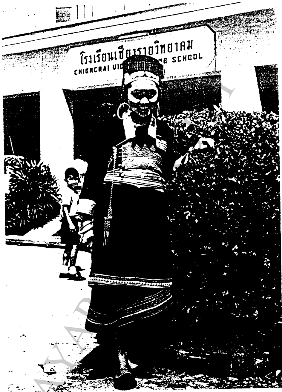
ชาวไตหย่าในจังหวัดเชียงราย